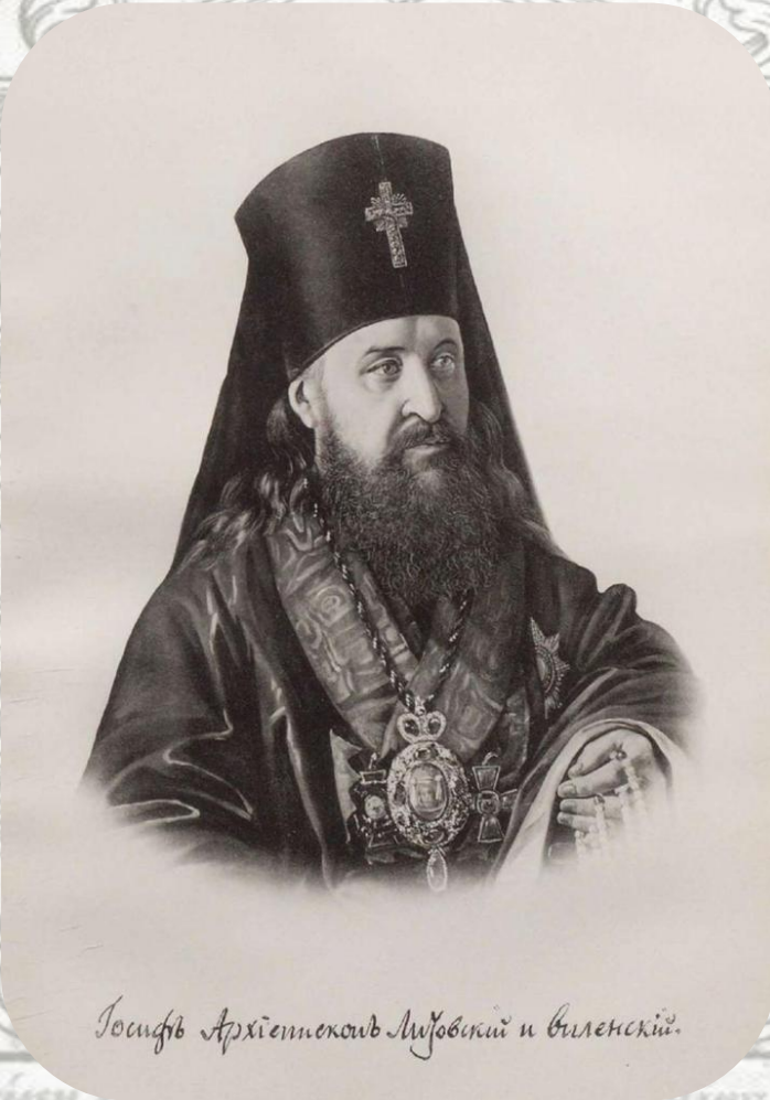
Іосифъ Архієпкоупъ Лівонскій и виленскій.